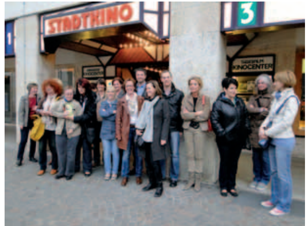
Die gut gelaunten Selbsthilfegruppen-Teilnehmer vor dem Stadtkino Villach

Die Liebesgeschichte im Film „Me too – wer will schon normal sein“, mit Pablo Pineda (Down Syndrom) in der Hauptrolle gab einen gefühlvollen Einblick in das Leben zwischen zwei Welten, zwischen Behinderung und sogenannter Normalität.