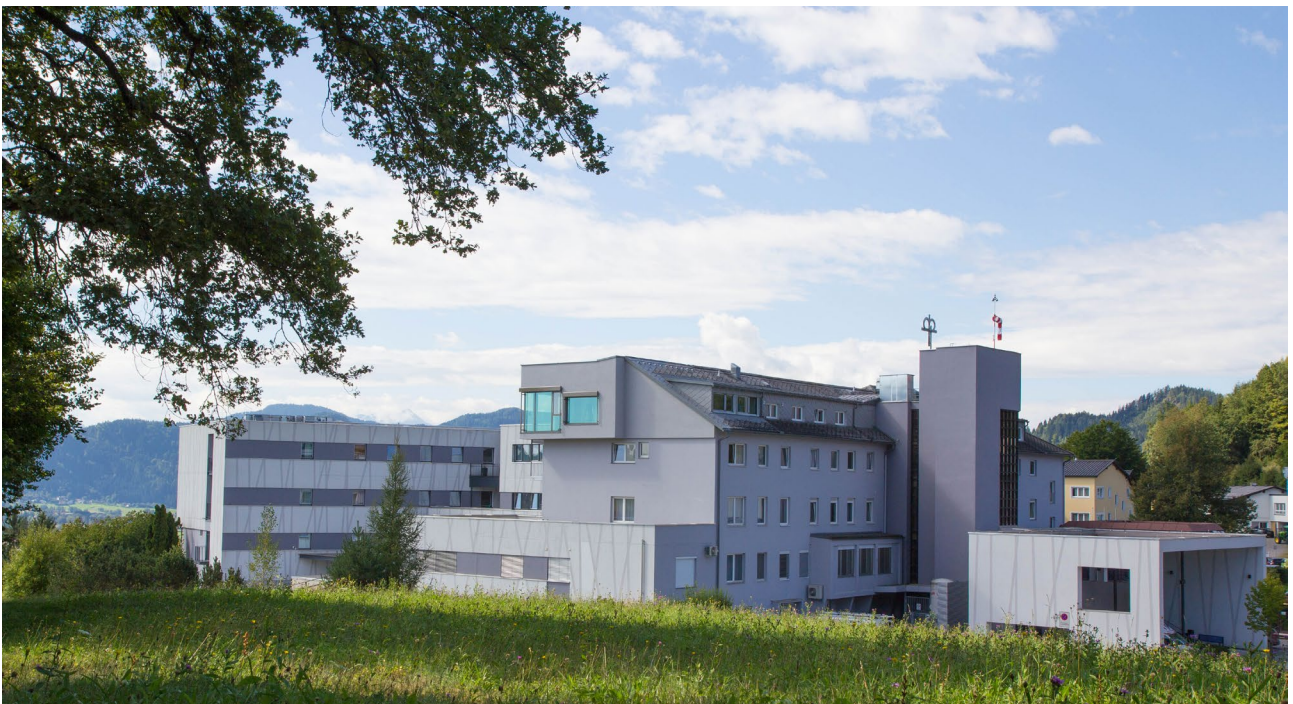
Krankenhaus Waiern

Selbsthilfe im Öffentlichen Krankenhaus Waiern der Diakonie de La Tour