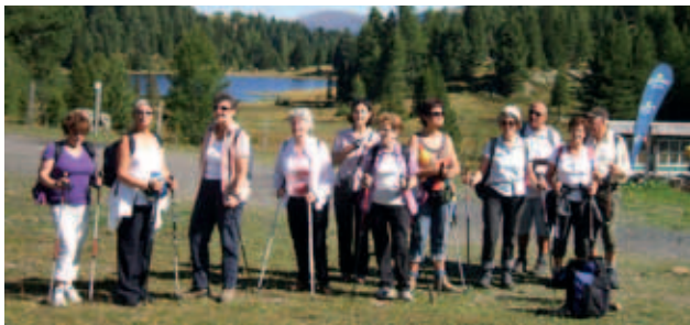
Die Teilnehmer der SHG bleiben in Bewegung

In diesem Jahr feiern die Teilnehmer der SHG Osteoporose Spittal/Drau mit einem Festakt das 10-jährige Bestehen der Selbsthilfegruppe. Wir gratulieren ganz herzlich und wünschen den Selbsthilfegruppenteilnehmern alles Gute für ihre weiteren Aktivitäten!